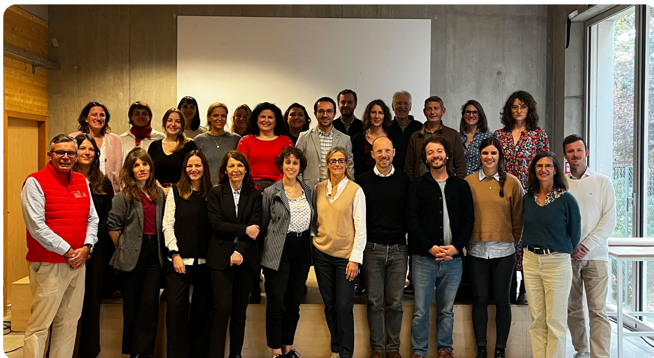
Les membres du collectif Entr&prends ton Avenir lors du bilan du programme